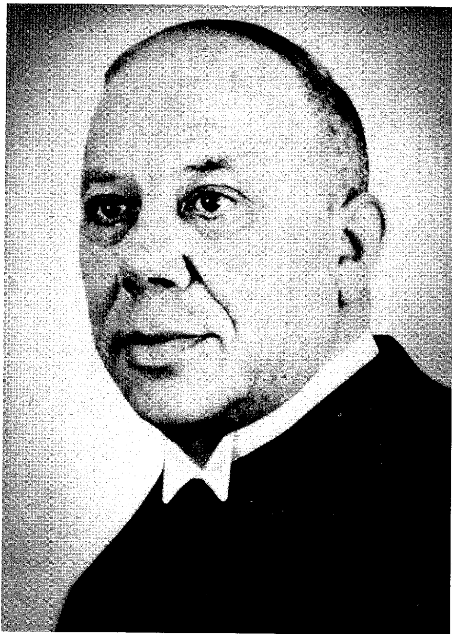
2. Ds. G.H. Kersten, leidend predikant in de Gereformeerde Gemeenten en oprichter van de Staatkundig Gereformeerde Partij.