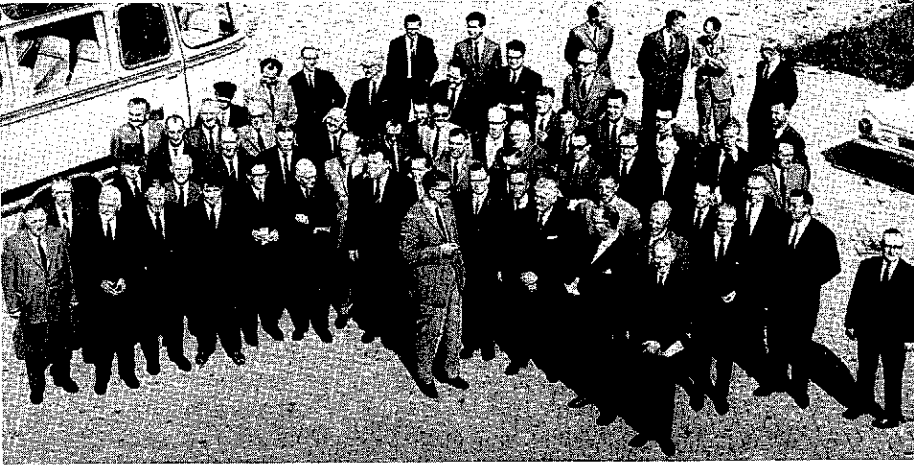
22. Eind augustus 1967 gingen de zeven colleges van burgemeesters en wethouders van het eiland Tholen, in gezelschap van de waterschapsbestuurders van het eiland, op excursie naar Ouddorp op Goeree om zich te laten voorlichten over de voor- en nadelen van een op recreatie en toerisme gericht gemeentelijk beleid. Het bezoek was een initiatief van de commissie Werkgelegenheid Eiland Tholen.